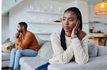
Diese Anzeichen verraten euch, dass eure Beziehung bald ihr Ende finden könnte – laut einer Paartherapeutin