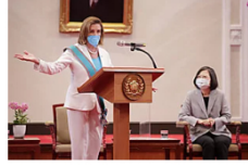
Die Taiwan-Reise des Bundestags ist nicht nur richtig, sie ist gerade jetzt extrem wichtig