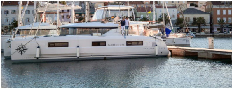
So sieht eine Yacht des Unternehmens aus.