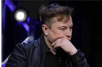
Er schlafe am Schreibtisch ein und feuere Mitarbeiter, die nicht seiner Meinung sind: Ex-Tesla-Manager berichtet über den Arbeitsalltag mit Elon Musk