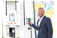
Grüner Wasserstoff aus Müll: So will dieser Deutsch-Amerikaner das hiesige Energieproblem lösen