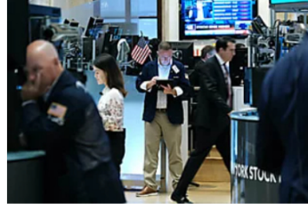
"Der Aktienmarkt hat sich mal wieder aus der Realität verabschiedet": Warum ein 26-jähriger Portfolio-Manager Anlegern ein böses Erwachen prophezeit