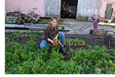
Ich habe mir für 550.000 Euro einen Bauernhof gekauft – das habe ich durch mein neues Leben auf dem Lan...