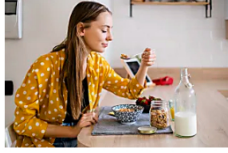
Intuitives Essen: Eine Expertin erklärt, wie der Trend funktioniert – und warum er besser ist als jede Diät