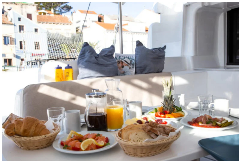
Mit Verpflegung kostet eine Woche auf der Yacht bis zu 19.200 Euro.

Dem Sport blieb sie über Jahre treu. Auch in ihrer Bachelor-Arbeit vergangenes Jahr befasste sie sich mit dem Segeltourismus. Durch ihre Recherche fand sie heraus, dass der Segelmarkt ein „boomender Nischenmarkt“ sei. Noch während ihres Studiums habe sie in ihrer Freizeit an ersten Business-Plänen für ihr Unternehmen gearbeitet