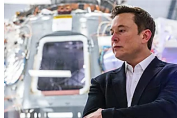
Ich wurde drei Monate nach Arbeitsbeginn bei Tesla entlassen – das waren die Warnsignale, die ich am Tag meiner Kündigung beobachtete