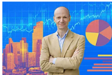
Finanzexperte Gerd Kommer verrät: So investiere ich privat mein Geld